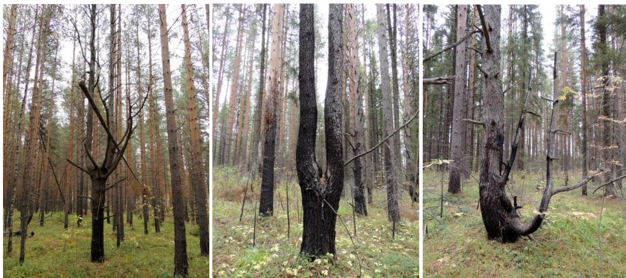
Причудливые деревья в сосновом бору.

4. Сосновый бор покрывает склоны горы. Деревья сосны принимают причудливые формы, напоминающие то «метателя копья», то камертон, то рогатое чудовище. На стволах деревьев сохранились следы низового пожара . Есть и погибшие во время пожара молодые ели. В пологе леса можно встретить кустарнички брусники, черники, разные грибы. О благополучии леса свидетельствует наличие крупных муравейников более 1 м высотой.