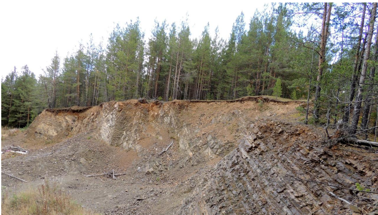
Карьер осенью.