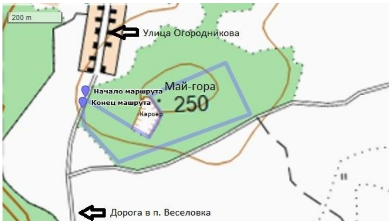
Рис. 1 Маршрут от автобусной остановки до Май-горы. Масштаб 1 : 20 000.

До места начала маршрута можно добраться на рейсовом автобусе «Карпинск–Веселовка». Необходимо сойти на остановке «Сады Рябинушка» и перейти на противоположную сторону дороги. В юго-восточном направлении идёт лесная дорога, пройдя по которой 300 м, мы выходим к восточному борту карьера. Поднимаемся по борту на самую высокую точку горы, откуда затем спускаемся по просеке в сосновый бор. Двигаемся по лесу 300 м в северо-восточном направлении, затем поворачиваем вправо под углом 90^\circ и идём в юго-восточном направлении 200 м. Снова поворачиваем направо и двигаемся вдоль границы леса в юго-западном направлении 500 м. Затем поворачиваем направо и идём к автомобильной дороге до автобусной остановки. Возвращаемся в город на автобусе. Стоимость проезда составляет 20 рублей (по состоянию на 2019 год).