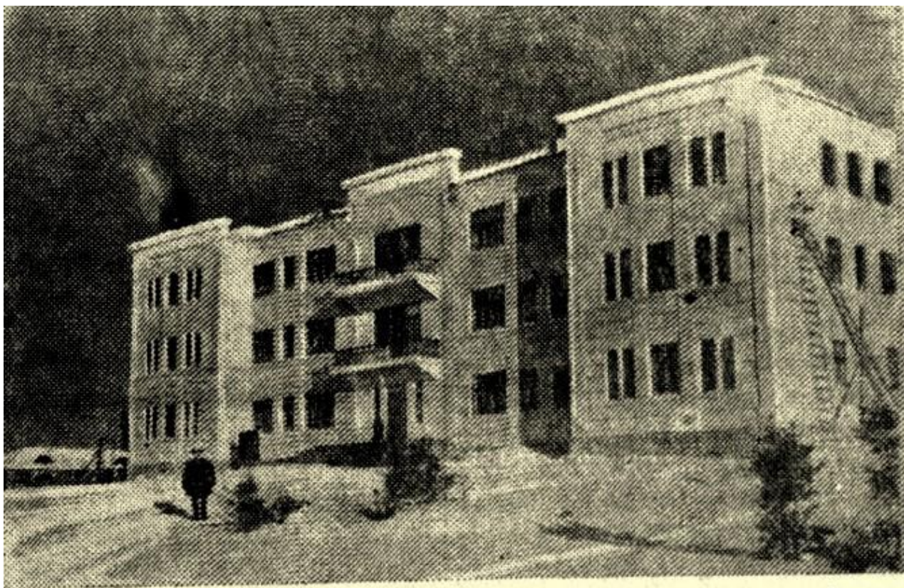
Здание управления треста «Богословскуголь».