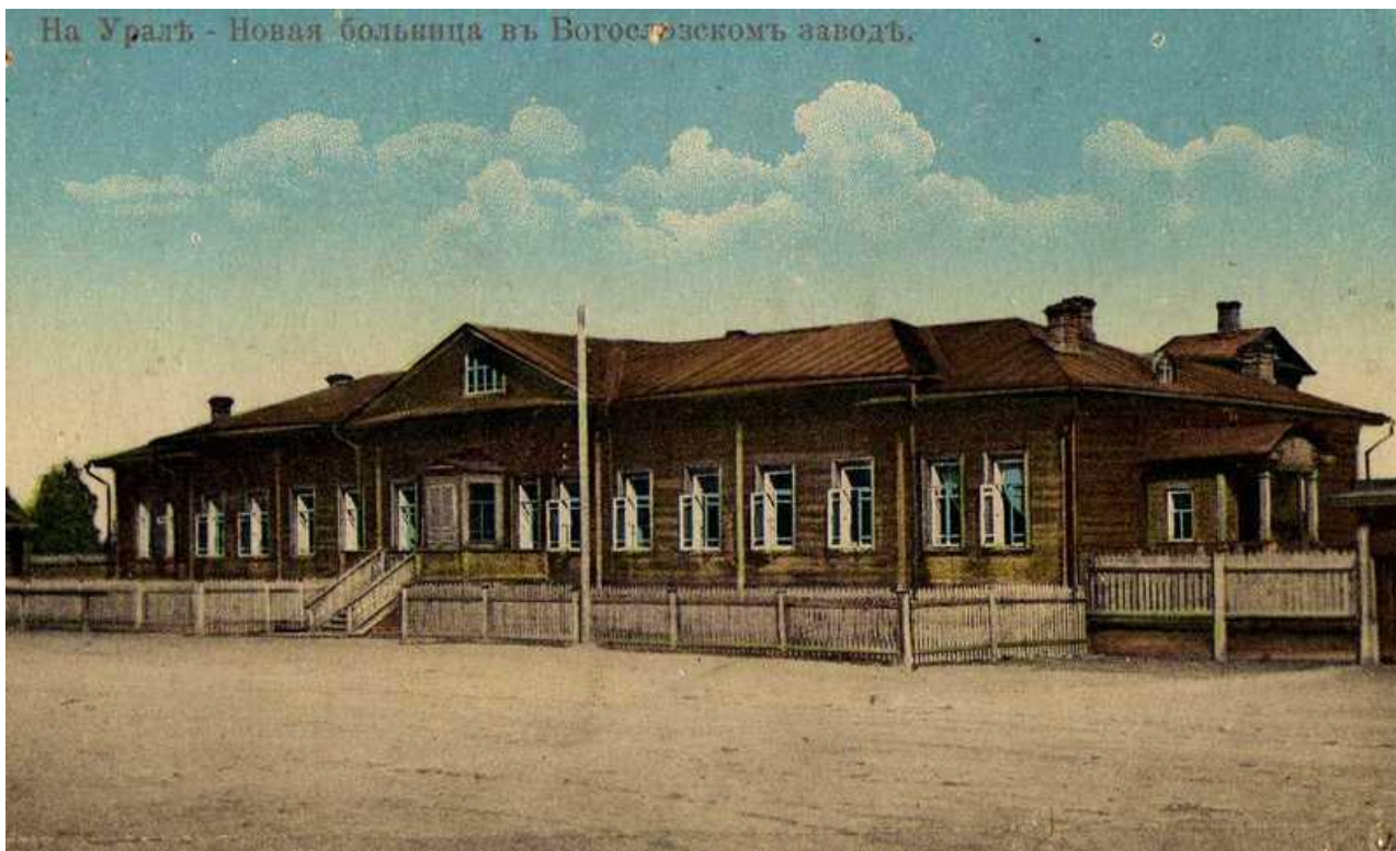
На Уралъ - Новая больница въ Богословскомъ заводѣ.